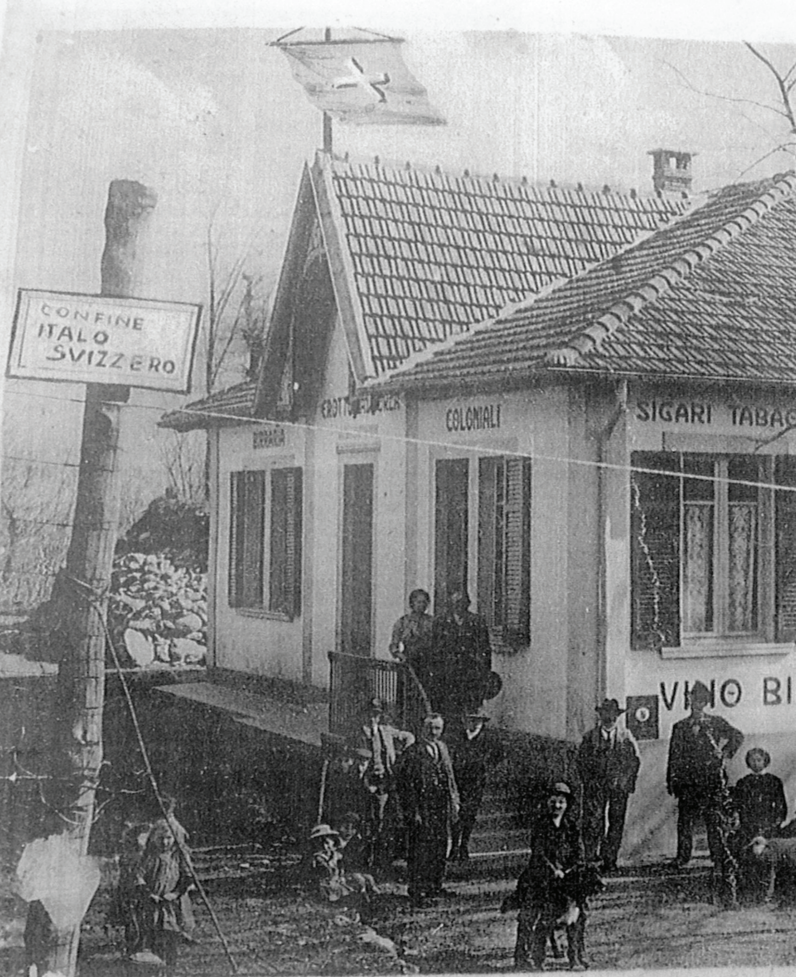
RODERO - Crotto Val Mo