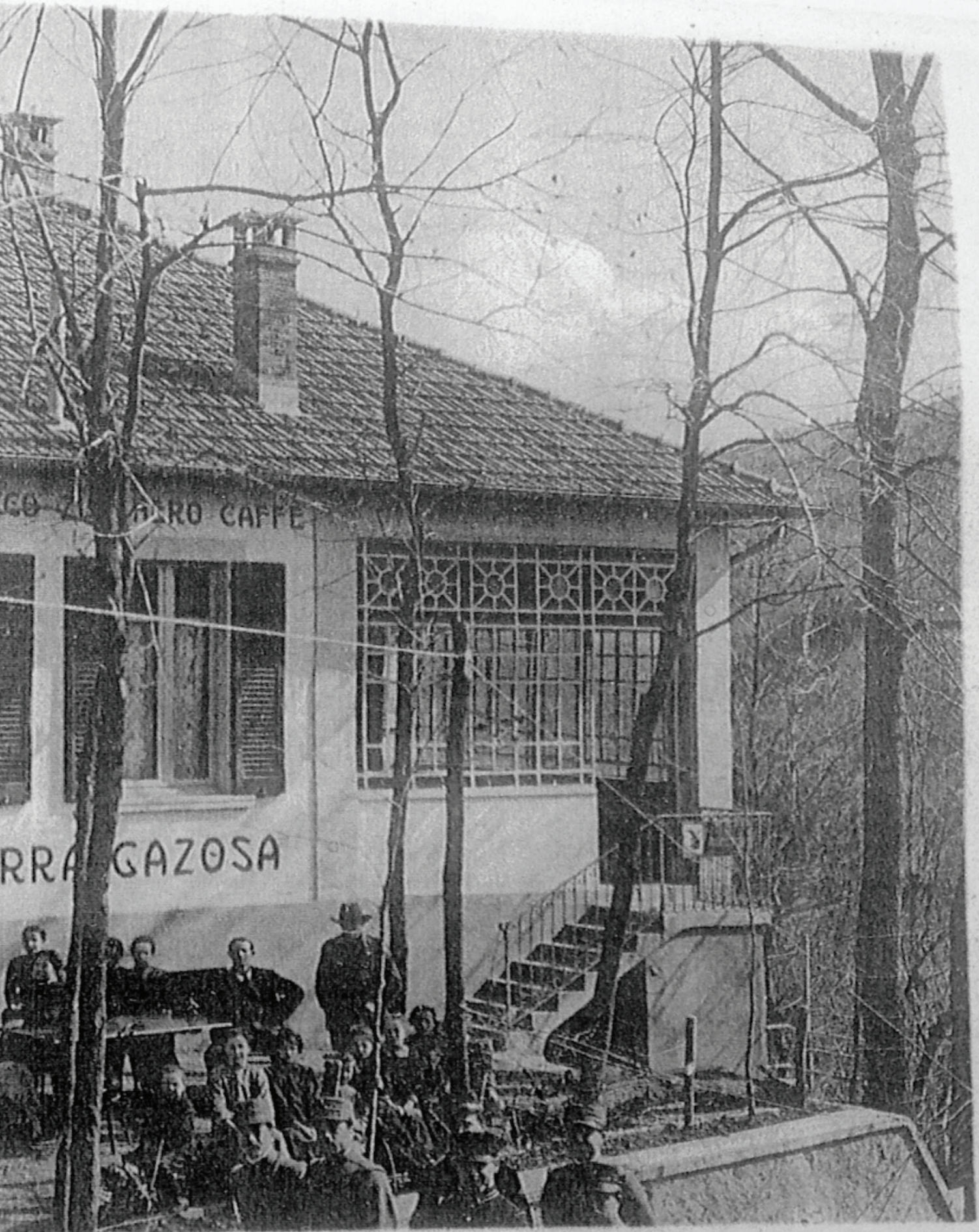
Italia - Confine Italo-Svizzero